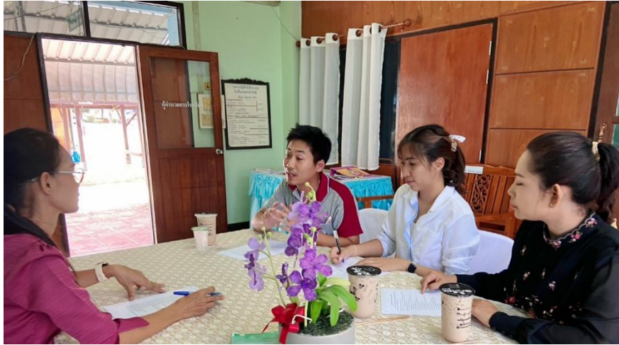
ภาพที่ 1 การวางแผนจัดทำหลักสูตรบูรณาการท้องถิ่นด้วยนวัตกรรมการพัฒนาทักษะ สำหรับการเป็นนวัตกรสื่อความหมายทางวัฒนธรรมและภูมิปัญญา